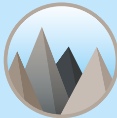
Hochgebirge (1.200 – 2.000 m)