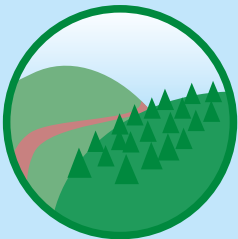
Mittelgebirge (400 – 700 m)